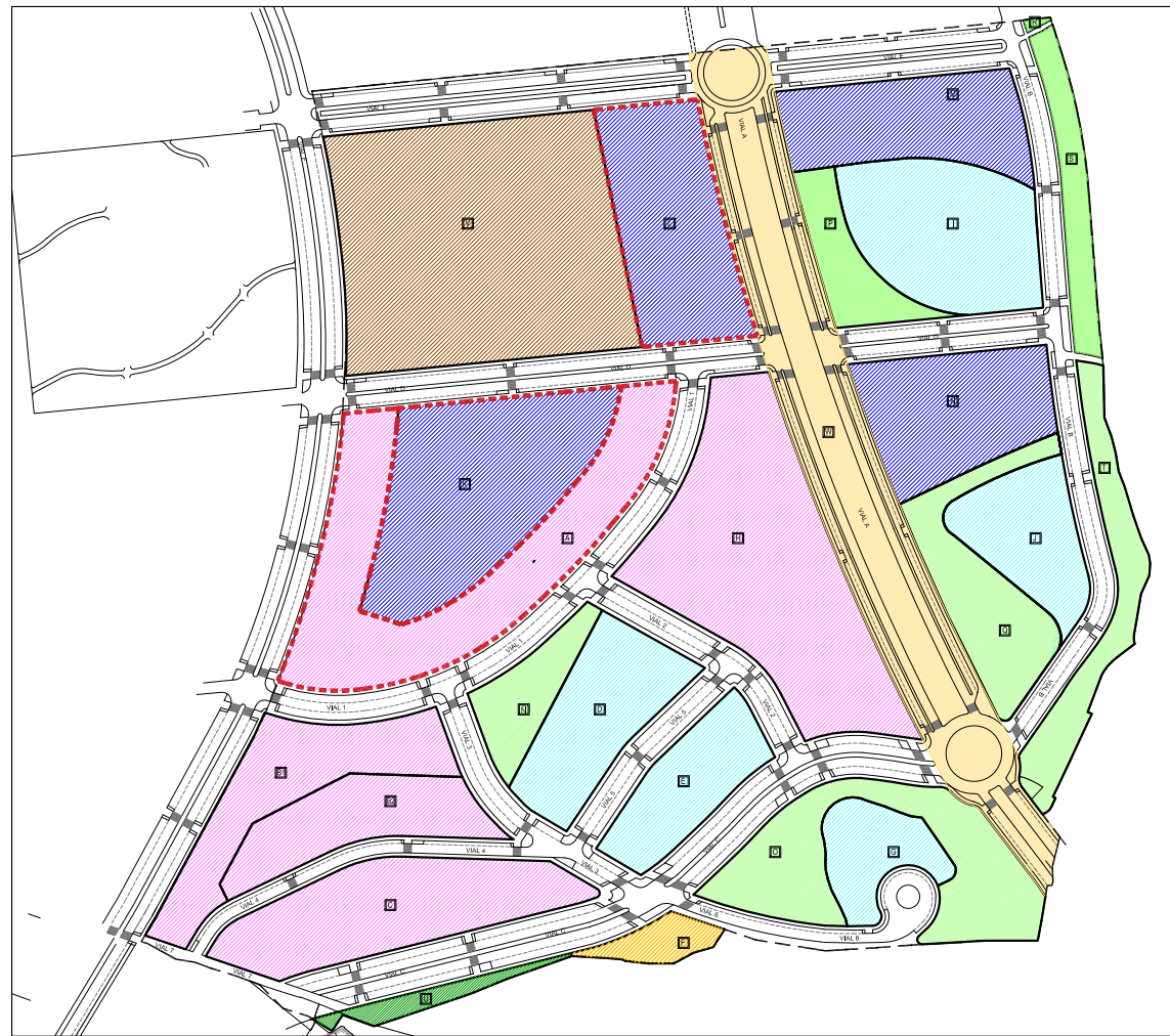
PLAN PARCIAL DEL SECTOR SUS MOT-5 ESCALA 1/5000